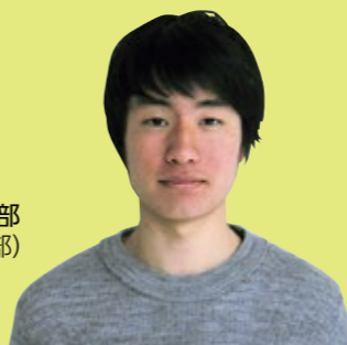
東北大学文学部(陸上部)

白石高校は目標や夢を追いかけ、たくさんの素晴らしい人々と出会い、自分を成長させるのに適した学校です。白石高校で過ごす3年間はきっと今後の人生において貴重な経験になるはずです。ぜひ白石高校に来てください。