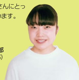
山形県立保健医療大学保健医療学部(水泳部)

私が白石高校で過ごした3年間は非常に充実したものでした。まず、部活動。私は水泳部に所属し、マネージャーとして活動していました。マネージャーの仕事は大変でしたが、人を支えることの難しさややりがいといった、授業では学べないことも学ぶことができました。この経験は、今後、人を支えていく上で常にいかしているのではないかと思います。そして、私がこの白石高校に入学して良かったと強く思っているのが大学受験の時でした。友人は将来の明確な目標をもって、私は常に刺激を受けていました。また、先生方は課外講習、個別指導、小論文対策、面接指導など、多方面から私たちをサポートしてくださいました。この素晴らしい環境のもとで過ごす3年間は、みなさんにとって、かけがえのないものになると思います。